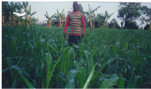
Cliché : TCHEKOTE H. 2004.

Cette exploitation appartenant à un membre du BINUM TONTINE qui n'a rien à envier des plantations industrielles de type commercial. Sa création en plein milieu rural, donne un cachet particulier au paysage, faisant ainsi apparaître quelque un hectare et demi de plantation de maïs inséré entre les vieilles plantations de polyculture. Même si on note une amélioration des conditions de vie au sein des exploitations bénéficiaires de microcrédit, il s'agit d'expériences isolées en milieu rural, où au regard de la vue d'ensemble du paysage, il se dégage de rares expériences réussies au sein de vastes étendus de polyculture traditionnelles. De là, se pose la question de la contribution réelle du microcrédit au développement au sein des campagnes où la pauvreté fait partie du quotidien des populations.