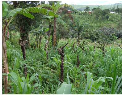
Photo 1 : Parcelle de café en cours de disparition à Fotomena (Ouest Cameroun).